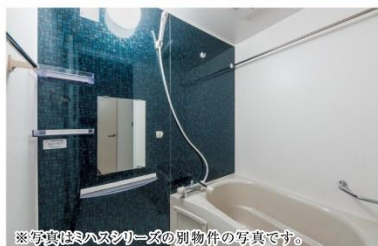
※写真等はミハスシリーズの別物件の写真です。