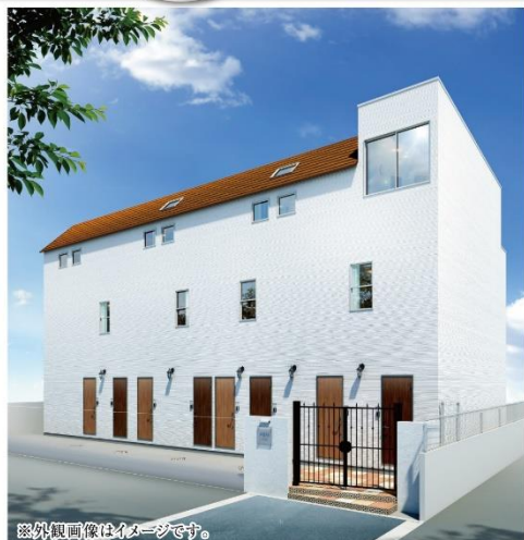
※外観画像はイメージです。